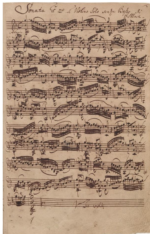
Figura 2: Adagio da sonata BWV 1001 em G menor para violino solo

Entretanto alguns fenômenos como a obra de J.S. Bach, seu pai, sugerem que a improvisação dos ornamentos apesar de ser uma meta almejada por muitos músicos, não era vista necessariamente como o único caminho a ser percorrido.