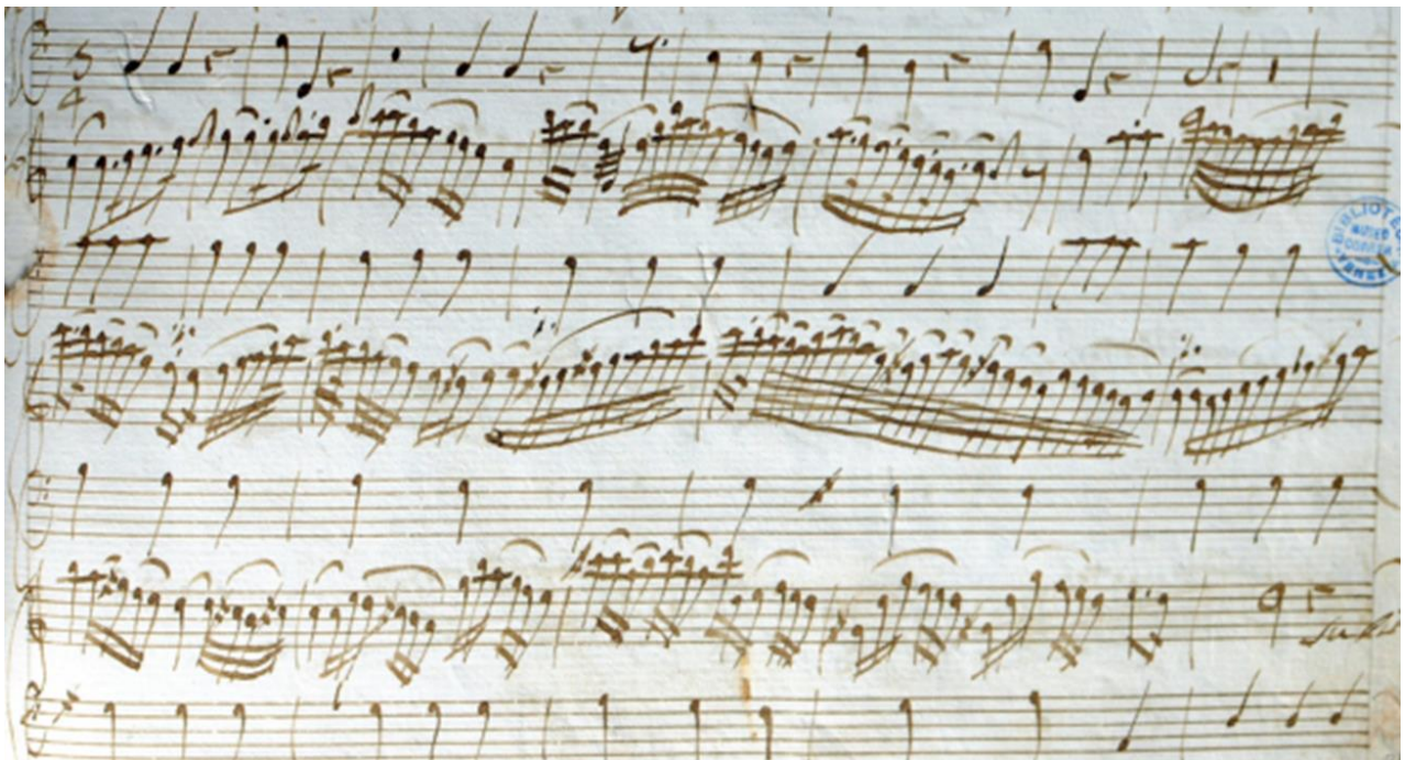
Figura 3: Movimento ornado e notado no livro de Anna Maria dal Violino

Além da preceptiva, um documento referente a uma das maiores performers do século XVIII, Anna Maria dal Violino, discípula de Antonio Vivaldi e primeira violinista da Ospedale della Pietà , também nos faz revelações interessantes sobre o mesmo assunto. Em um caderno, foram encontrados diversos espécimes de cadenzas e de ornamentação livre notadas, conforme podemos ver na figura 3 um exemplo: