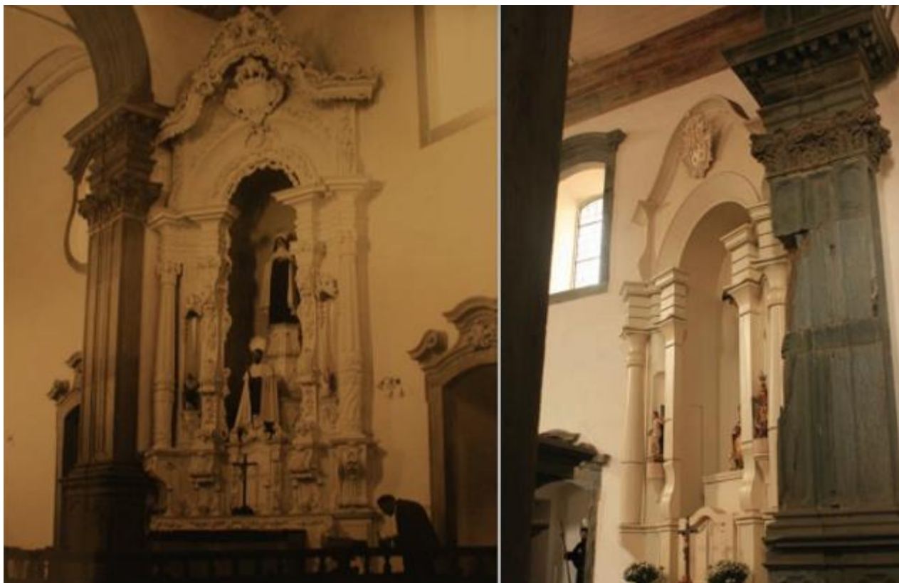
Figura 1: Igreja de Nossa Senhora do Carmo restaurada após o incêndio de 1998. À esquerda uma parte do altar não atingida pelo fogo e à direita uma parte reconstruída. Saviani (2014, p.78)

Saviani (2014) enfatiza como os tratados de arquitetura versam sobre o ornamento e seu correto desenho na construção e através de fotos tirada da restauração de uma igreja setecentista brasileira (Figura 1) que após um incêndio parcial teve o altar reconstruído apenas com a estrutura, demonstra como o discurso reproduzido com a ausência de ornamentação está distante da eloquência de sua concepção: